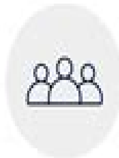
Customer account data