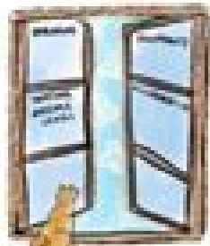
SIMPLE PRACTICES BY OFFERING PLAYERS AN OUTSIDE WORLD