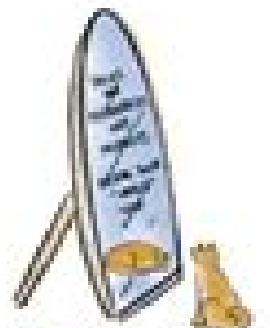
EMPOWERING PRACTICES EMITS SELF-REFLECTION