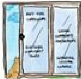
PROVIDING OPPORTUNITY & CHOICE WHEN WE LEARN TO SEE OURSELVES IN RELATION TO OTHERS WITHIN THE CONTEXT OF THE LARGER LIVING EXPERIENCE