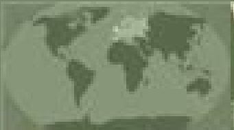
United Kingdom - Great Britain